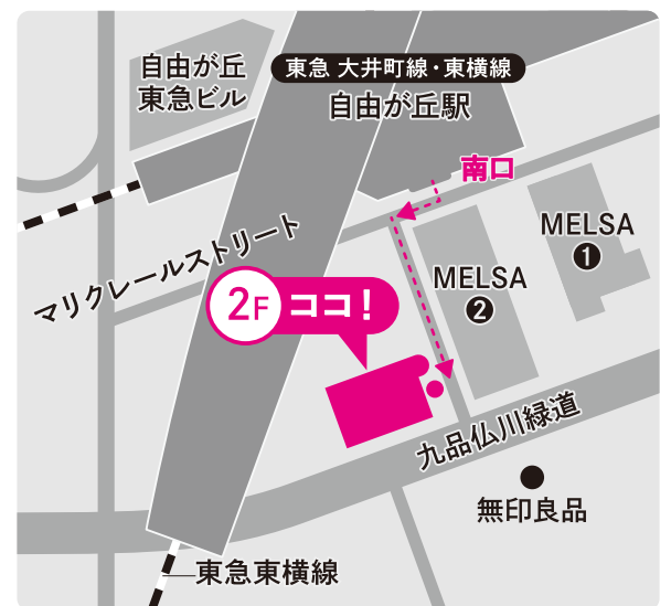
東急大井町線・東横線「自由が丘駅」南口を出て徒歩1分 南口を出て右、MELSA②の角を左に曲がる