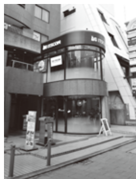
自由が丘駅南口からすぐ！ 丸い建物の2階がお店です。